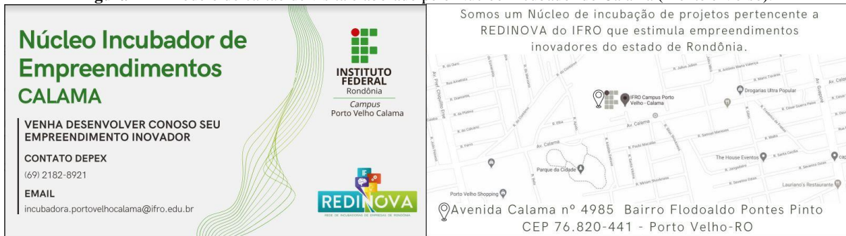
Figura 12 – Modelo do cartão de visita elaborado pelo Núcleo Incubador do Calama (Frente e Verso).

três empresas selecionadas foram GRÁFICA BELLAINFO (CNPJ 32.874.790/0001-20), MM GRÁFICA (CNPJ 01.176.195/0001-98) e VEIGA IMPRESS (CNPJ 35.582.344/0001-41), cujos preços foram R$ 140,00, R$ 90,00 e R$ 140,00, respectivamente.