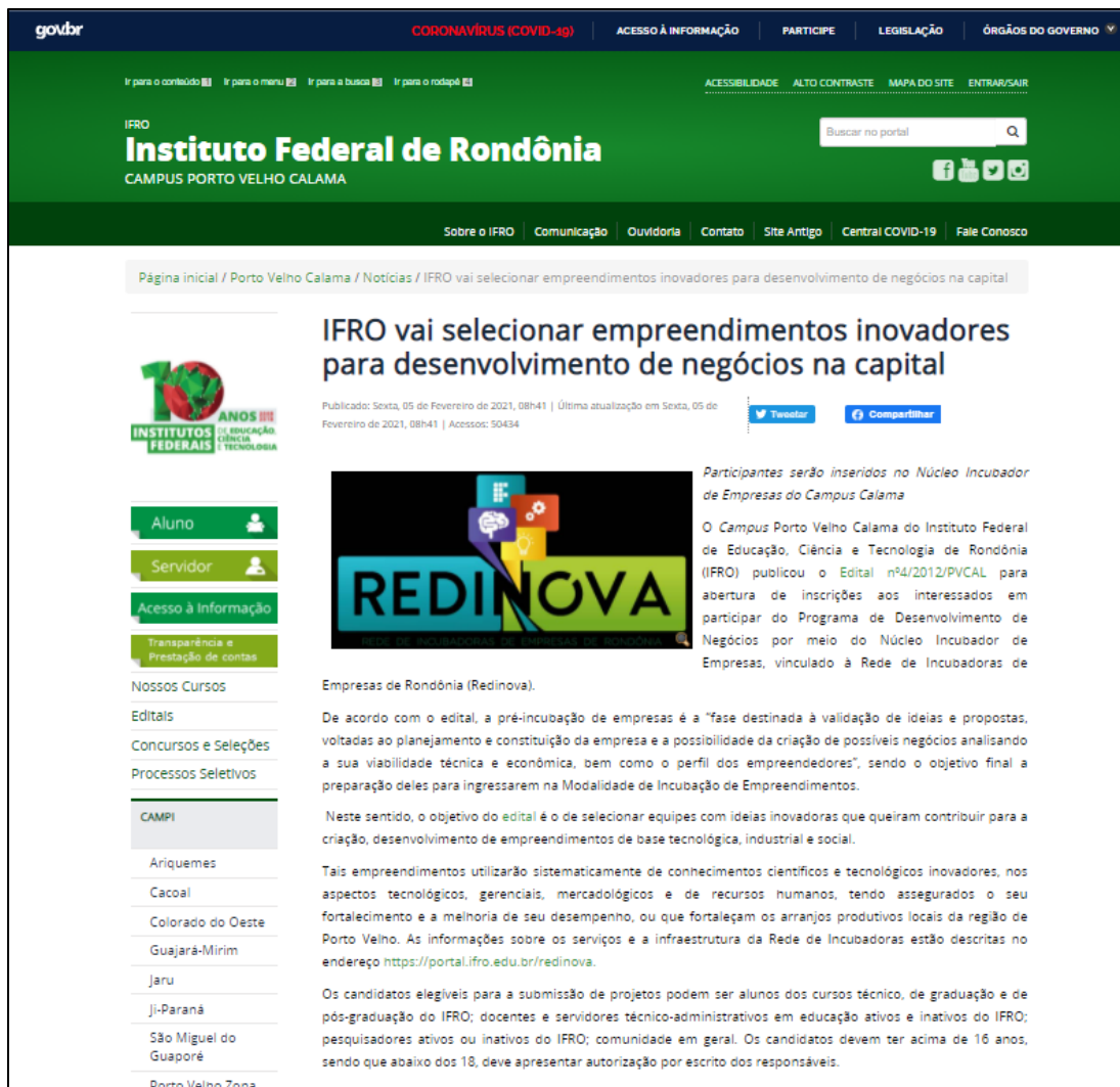
Figura 2 - Publicação 01 sobre o edital de incubação.