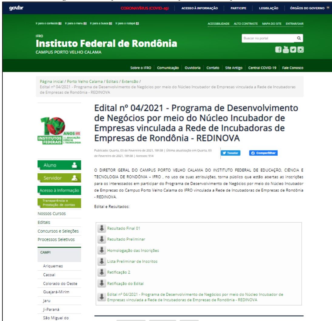
Figura 1 - Publicação do edital de incubação e suas retificações e resultados.