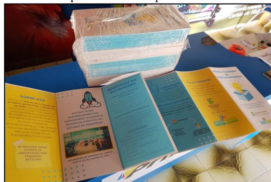
Figura 11 — Folder impresso elaborado pelo Núcleo Incubador do Calama.

Portanto de acordo com o critério do menor preço, a empresa selecionada para impressão do folder (ver a Figura 11) foi a PRINT GRÁFICA (CNPJ 30.509.120./0001-80), cuja nota fiscal está presente no Anexo XII.