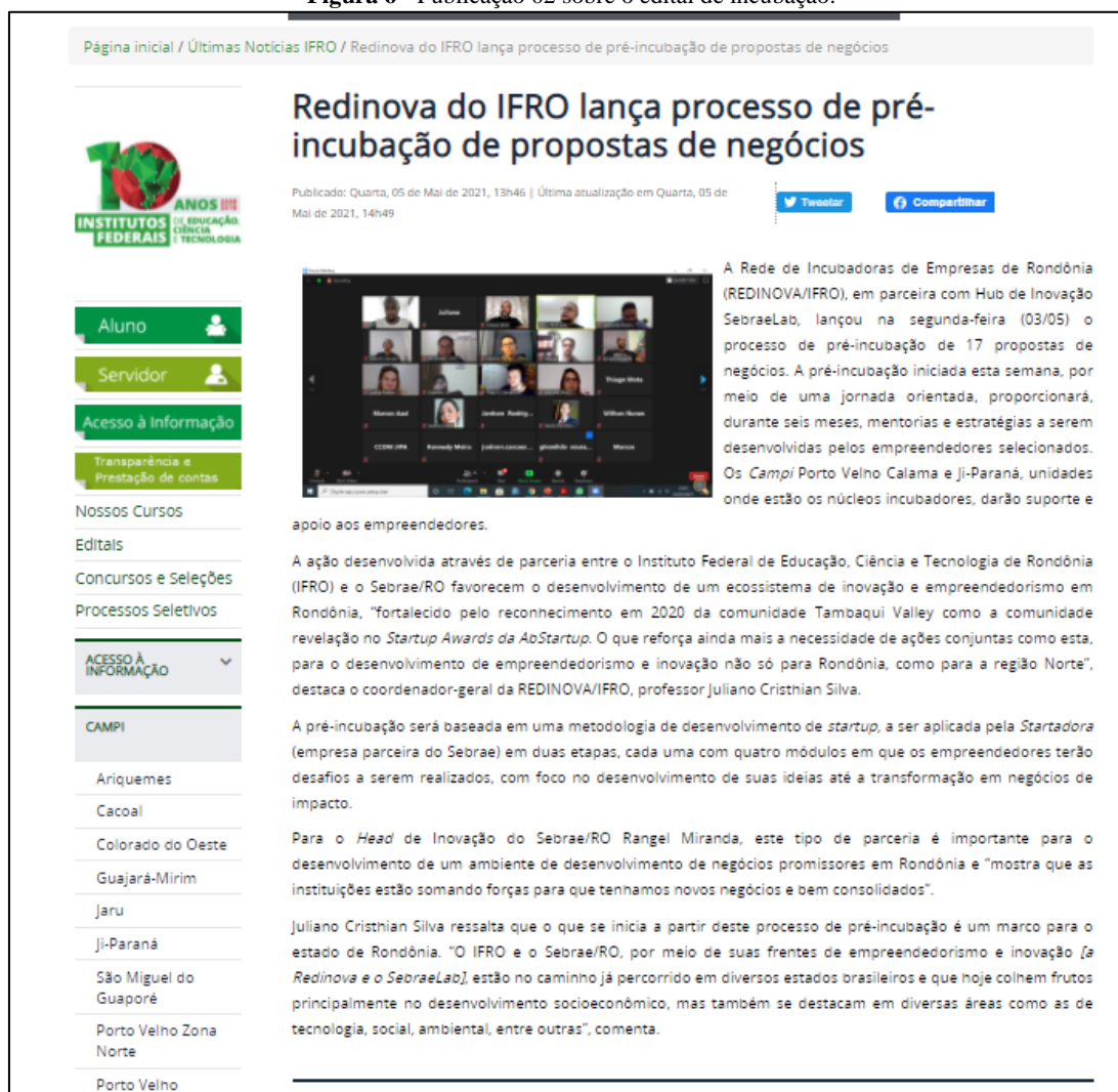
Figura 6 - Publicação 02 sobre o edital de incubação.

estavam trabalhando sincronizados para otimizarem a implementação do programa de pré-incubação (ver Figura 06).