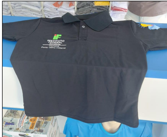
Figura 8 - Camisa Customizada pelo Núcleo Incubador do Calama