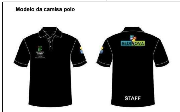
Figura 7 – Modelo da Camisa Customizada pelo Núcleo Incubador do Calama.