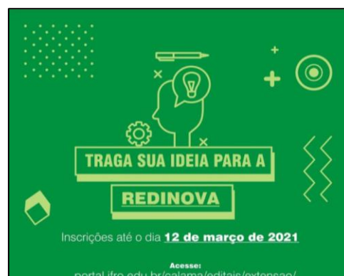
Figura 3 - Postagem sobre o prazo de inscrição.