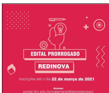
Figura 4 - Postagem sobre a prorrogação do edital.